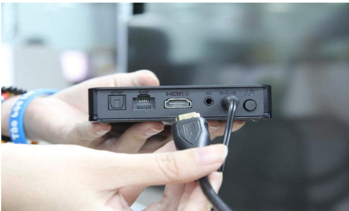
Sau khi lắp dây nguồn vào Quý khách tiếp tục nối dây HDMI vào Box