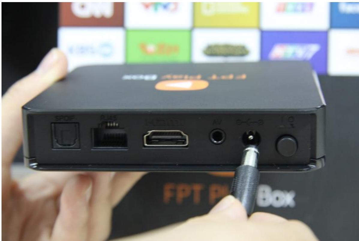
Lắp dây nguồn vào FPT Play Box