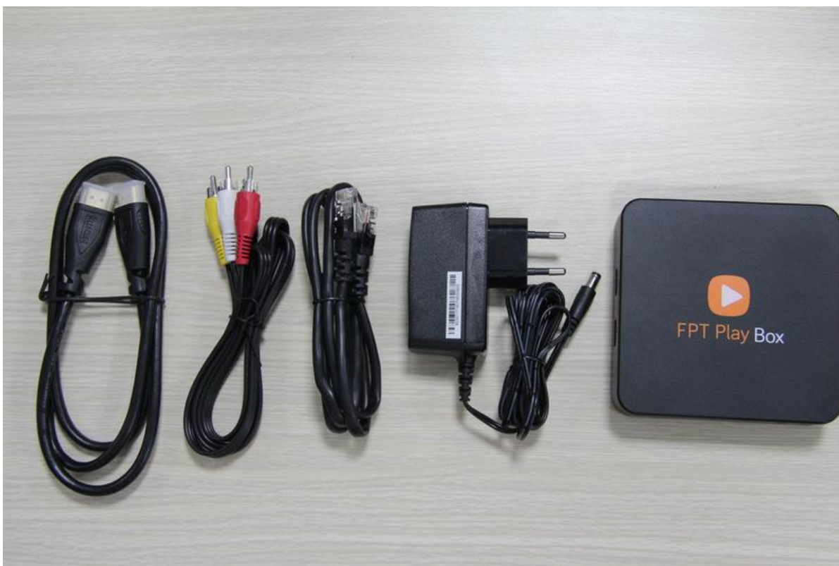
Các loại dây sẽ được gắn với Box (từ trái qua phải): Dây HDMI, dây AV, dây cáp LAN, dây nguồn và FPT Play Box

Các thao tác cài đặt FPT Play Box giúp Quý khách nắm rõ hơn: